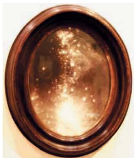
Fig. 1: Fusion de jeunes étoiles dans Cassiopée, par la photographe-astronome inexistante Anabella Gaposchk.

Quelques «oeuvres» sont présentées en ces pages, notamment la Nébuleuse Bikini qui devrait alerter les visiteurs attentifs de l'exposition puisque le bikini est né beaucoup plus tard 1 . Les images sont fabriquées par dispersion de farine, de sucre et d'autres ingrédients culinaires.