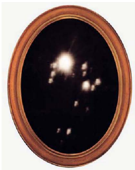
Fig. 3: Amas ouverts dans le Sagittaire.

ne, souvent dotés de verres courbes. La fausse vie de Gaposchk est faite de divers contacts décisifs pour son orientation, d'appartenance à de soi-disant