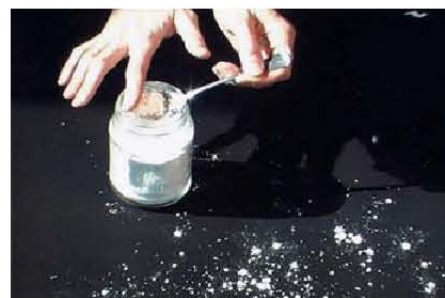
Fig. 5: Fabrication de fausses photographies astronomiques par saupoudrage de farine.